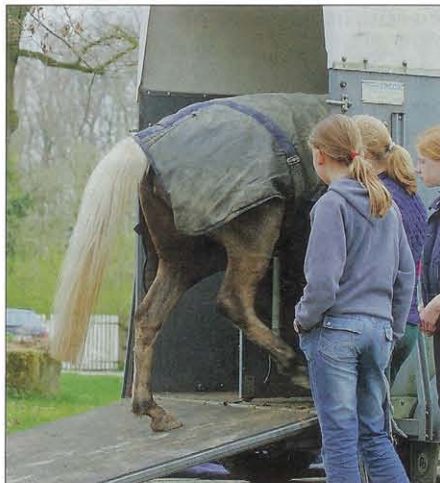
Fast geschafft: Das Pferd folgt der Trainerin willig in den Anhänger.

kehrts gerecht wird. Darüber hinaus muss seine Innenausstattung dem Schutz des Pferdes beim Transport dienlich sein. Beim Kauf eines Anhängers ist darauf unbedingt zu achten.