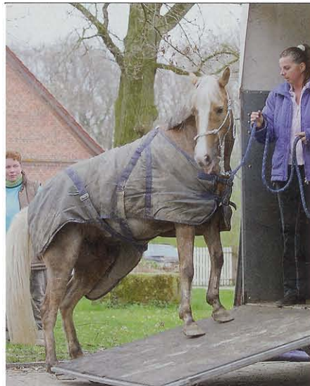
Es ist durchaus erlaubt, dass das Pferd auf der Laderampe verharret und sich die Sache anschaut.

weise und Kommunikation des Pferdes. Ziel ist es, Menschen in kurzer Zeit beizubringen, dem Pferd das nötige Sicherheitsgefühl und Vertrauen zu vermitteln, bis ihm sein Pferd angst- und stressfrei in den Anhänger folgt und ruhig darin stehen bleibt, auch während der Fahrt.